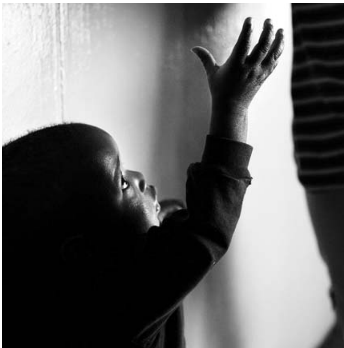
Un niño atendido en un hospital de caridad de Johannesburgo (Sudáfrica).

En cualquier caso, está demostrado que la buena voluntad no es suficiente para obtener resultados, por ello, la donación exige de un seguimiento para corroborar que lo dispuesto ha servido para aliviar las condiciones de los más desfavorecidos. Y la falta de información ya no puede seguir siendo una excusa para no colaborar con las ONGs.