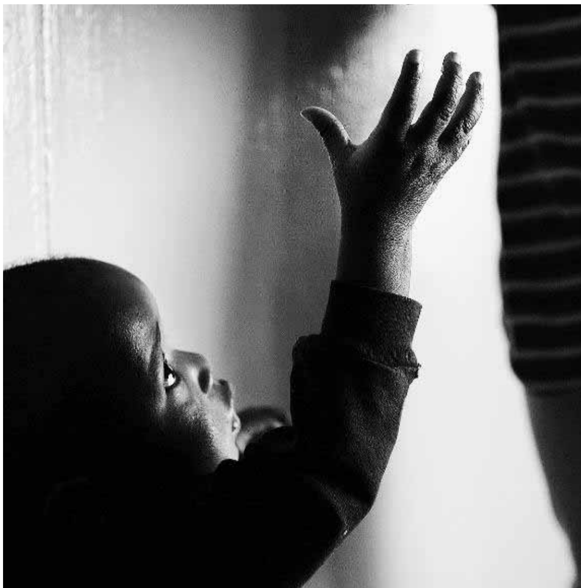
Un niño atendido en un hospital de caridad de Johannesburgo (Sudáfrica).

En cualquier caso, está demostrado que la buena voluntad no es suficiente para obtener resultados; por ello, la donación exige de un seguimiento para corroborar que lo dispuesto ha servido para aliviar las condiciones de los más desfavorecidos. Y la falta de información ya no puede seguir siendo una excusa para no colaborar con las ONG.