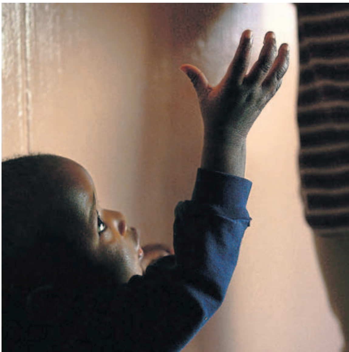
Un niño atendido en un hospital de caridad de Johannesburgo (Sudáfrica).

tran los Ministerios de Sanidad y Trabajo o la Comunidad de Madrid, y por empresas privadas como Banco Santander, Deutsche Bank, las Fundaciones Mutua Madrileña y Juan Miguel Villar Mir o PwC España, la Fundación Lealtad ha examinado en el 2010 a 144 ONG que gestionan 1.100 millones al año y cuentan con 1.302.410 socios,